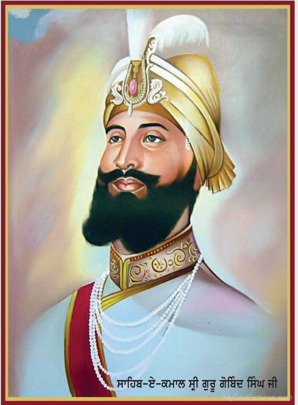
ਸਾਹਿਬ-ਏ-ਕਮਾਲ ਸ੍ਰੀ ਗੁਰੂ ਗੋਬਿੰਦ ਸਿੰਘ ਜੀ

ਜਉ ਤਉ ਪ੍ਰੇਮ ਖੇਲਨ ਕਾ ਚਾਉ, ਸਿਰੁ ਧਰਿ ਤਲੀ ਗਲੀ ਮੇਰੀ ਆਉ ਇਤੁ ਮਾਰਗਿ ਪੈਰ ਧਰੀਜੈ, ਸਿਰੁ ਦੀਜੈ ਕਾਣਿ ਨ ਕੀਜੈ