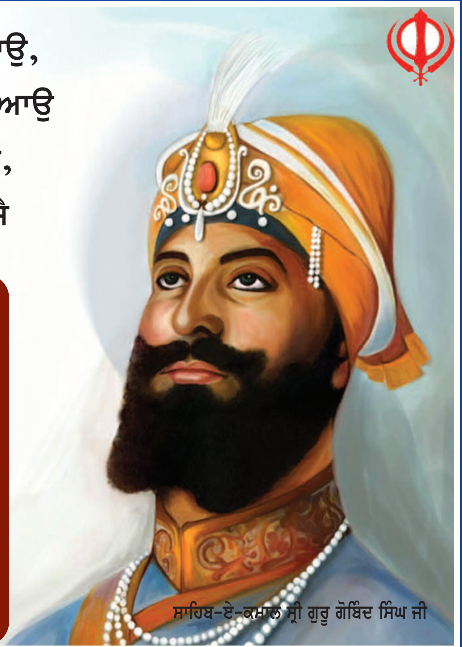
ਸਾਹਿਬ-ਏ-ਕਮਾਲ ਸ੍ਰੀ ਗੁਰੂ ਗੋਬਿੰਦ ਸਿੰਘ ਜੀ

ਦਸਮ ਪਾਤਸ਼ਾਹ ਸਾਹਿਬ ਸ੍ਰੀ ਗੁਰੂ ਗੋਬਿੰਦ ਸਿੰਘ ਜੀ ਦੇ 350ਵੇਂ ਪ੍ਰਕਾਸ਼ ਦਿਹਾੜੇ ਅਤੇ ਨਵੇਂ ਸਾਲ ਦੀਆਂ ਸਮੂਹ ਸਿੱਖ ਸੰਗਤ ਅਤੇ ਦੇਸ਼-ਵਿਦੇਸ਼ ਵਿਚ ਵੱਸਦੀ ਕੁੱਲ ਲੋਕਾਈ ਅਤੇ ਸ਼ਰਧਾਵਾਨ ਸਿੱਖ ਕੌਮ ਨੂੰ ਲੱਖ-ਲੱਖ ਵਧਾਈ