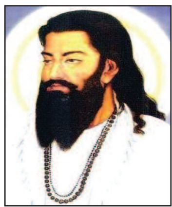
ਧੰਨ ਧੰਨ ਸ੍ਰੀ ਗੁਰੂ ਰਵਿਦਾਸ ਜੀ

ਸਮੂਹ ਗੁਰੂ ਪਿਆਰੀ ਸਾਧ ਸੰਗਤ ਨੂੰ ਨਵਾਂ ਸਾਲ 2017 ਦੀਆਂ ਲੱਖ-ਲੱਖ ਵਧਾਈਆਂ