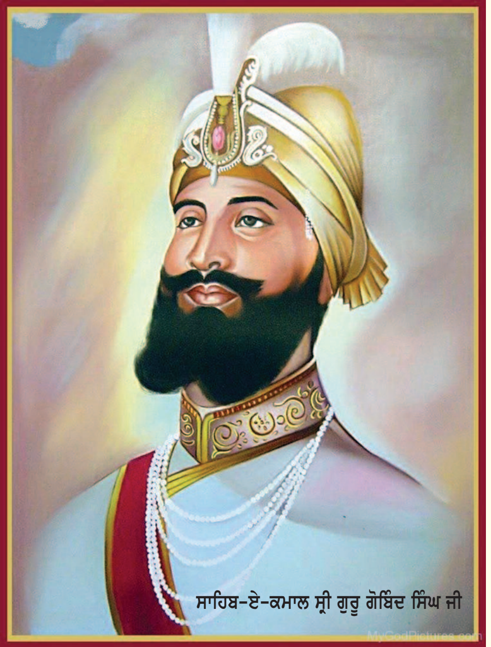
ਸਾਹਿਬ-ਏ-ਕਮਾਲ ਸ੍ਰੀ ਗੁਰੂ ਗੋਬਿੰਦ ਸਿੰਘ ਜੀ

ਦਸਮ ਪਾਤਸ਼ਾਹ ਸਾਹਿਬ ਸ੍ਰੀ ਗੁਰੂ ਗੋਬਿੰਦ ਸਿੰਘ ਜੀ ਦੇ 350ਵੇਂ ਪ੍ਰਕਾਸ਼ ਦਿਹਾੜੇ ਅਤੇ ਨਵੇਂ ਸਾਲ ਦੀਆਂ ਸਮੂਹ ਸਿੱਖ ਸੰਗਤ ਅਤੇ ਦੇਸ਼-ਵਿਦੇਸ਼ ਵਿਚ ਵੱਸਦੀ ਕੁੱਲ ਲੋਕਾਈ ਅਤੇ ਸ਼ਰਧਾਵਾਨ ਸਿੱਖ ਕੌਮ ਨੂੰ ਲੱਖ-ਲੱਖ ਵਧਾਈ